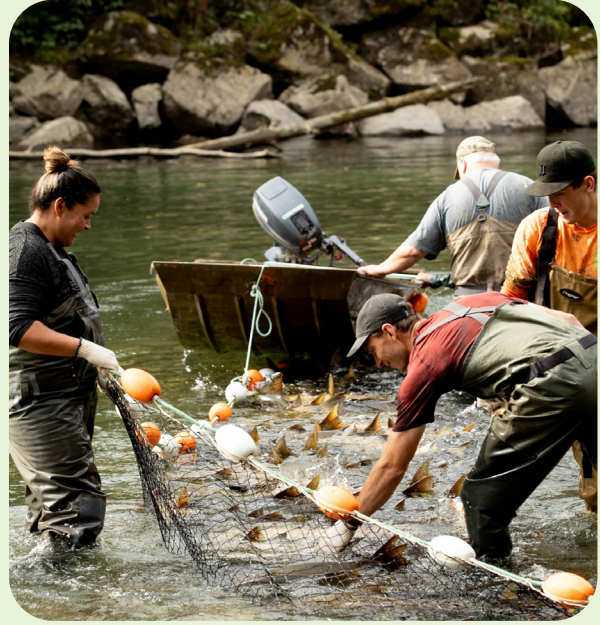
Fuente: Primera Nación Huu-ay-aht (2024), Salmon survey [Estudio sobre el salmón].

Para obtener más información, consúltese: Huu-ay-aht works toward salmon renewal with Sarita River restoration project [Trabajos de la comunidad Huu-ay-aht para la recuperación del salmón con el proyecto de restauración del río Sarita]; documento disponible únicamente en inglés.