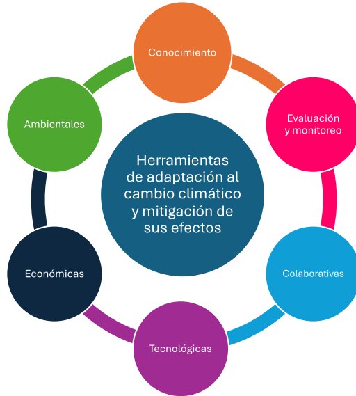
Figura 2. Clasificación de herramientas para adaptarse al cambio climático y mitigar sus efectos

diversas categorías que corresponden a los aspectos clave definidos para clasificar los recursos incluidos en el presente proyecto: