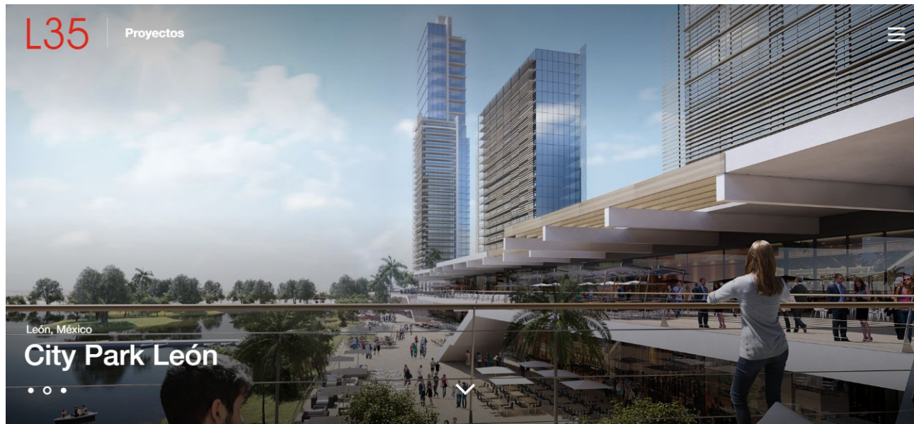
Proyección del Proyecto ( L35 Arquitectos )

Para tener una imagen más completa de lo que podría ser El Proyecto “City Park - Primera Etapa” y su influencia sobre el Humedal del Parque Los Cárcamos , puede visitar la página web del despacho L35 Arquitectos en la que podrá encontrar proyecciones como la que a continuación se inserta: