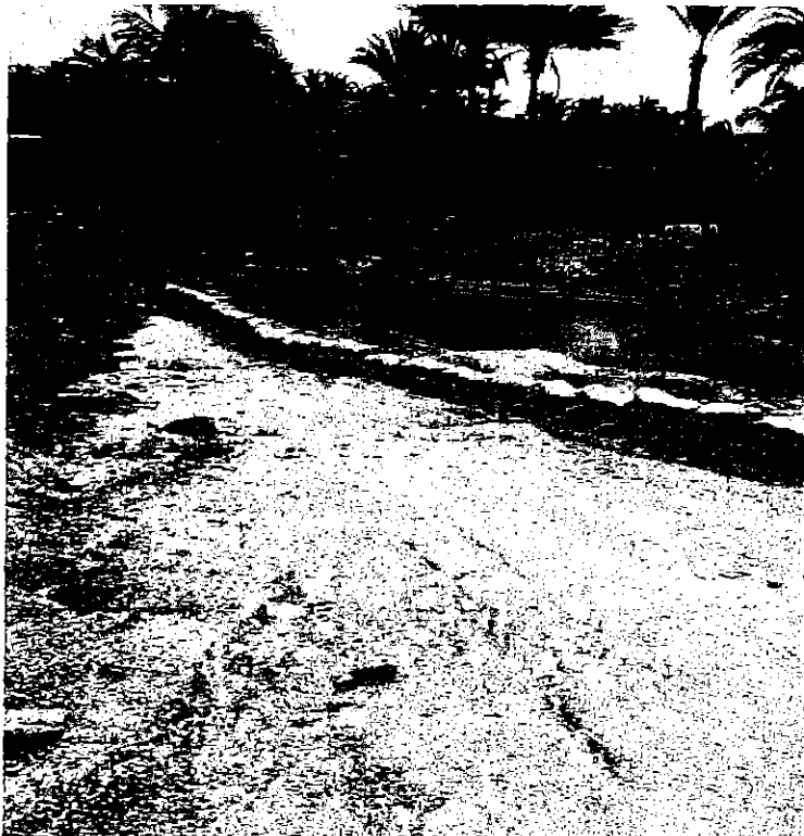
FOTOGRAFÍA DEL 17 DE SEPTIEMBRE DE 2018.