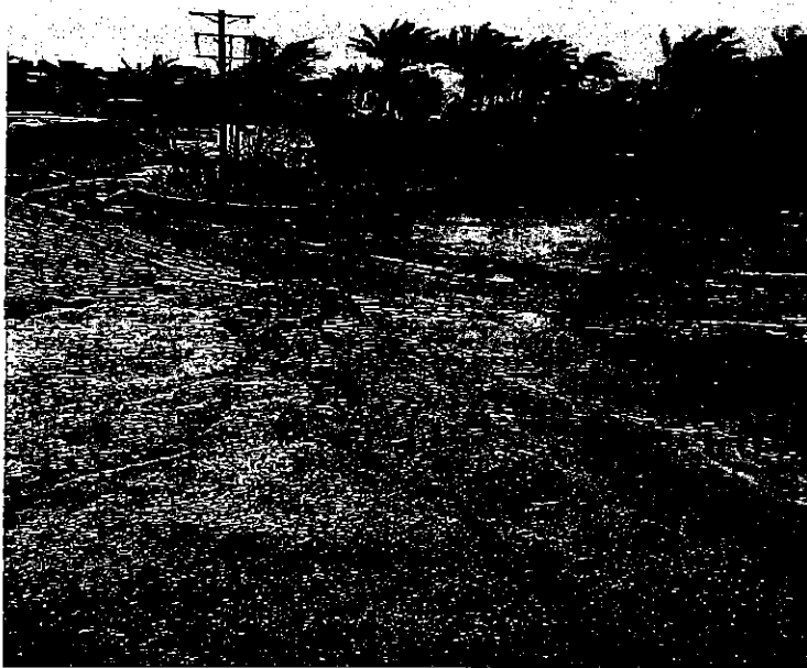
FOTOGRAFÍA DEL 02 DE SEPTIEMBRE DE 2018.