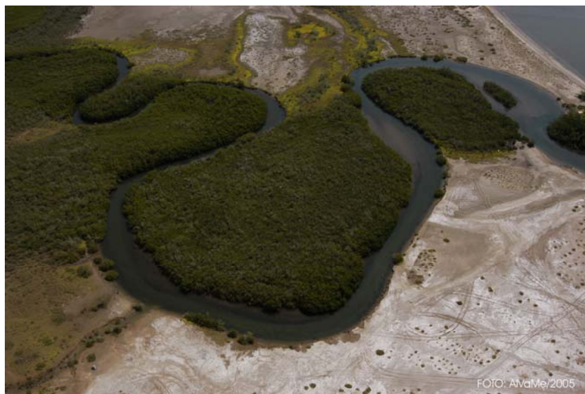
Estero Zacatecas Detalle