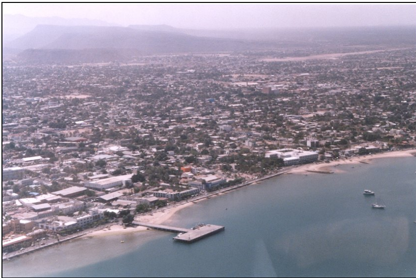
Desarrollo Urbano en La Ensenada de La Paz