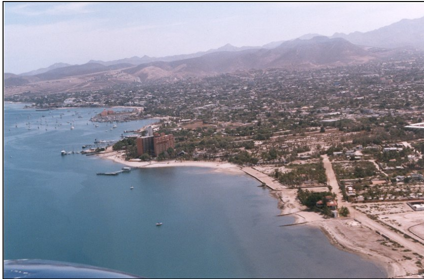
Ensenada de La Paz