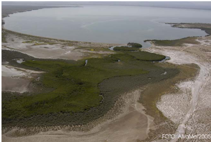
Estero Zacatecas General