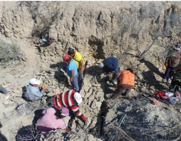
Construcción de Presas Filtrantes de Piedra Acomodada