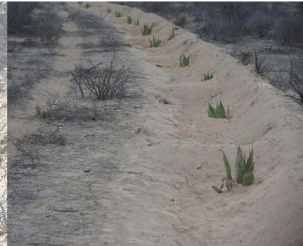
Plantación de Maguey en Zanja-bordo 5