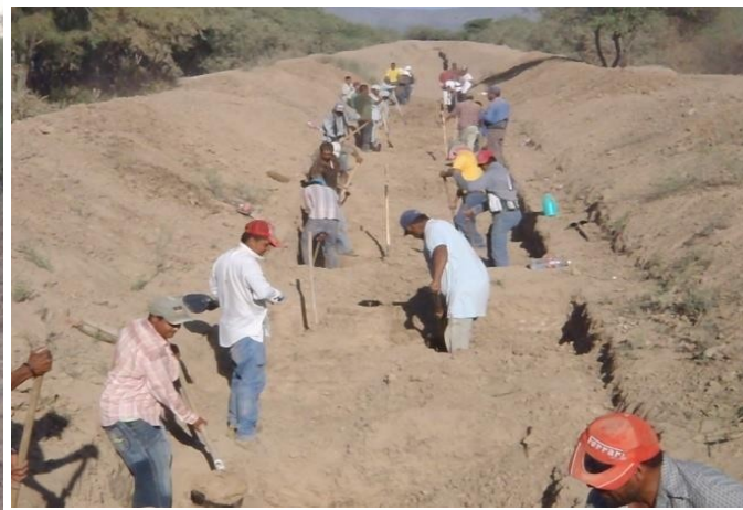
Excavación y nivelación del Canal