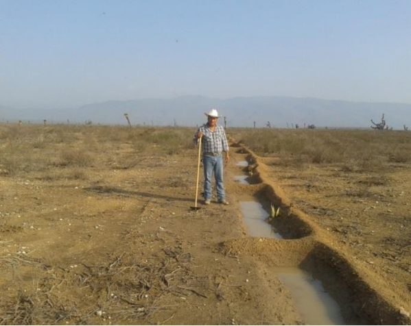
Zanja bordo para retención de Humedad y Maguey Forrajero