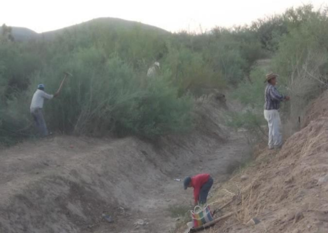
Limpieza de Canal, antes de época de lluvia