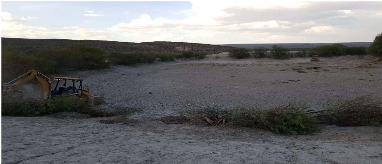
Tanque abrevadero totalmente azolvado