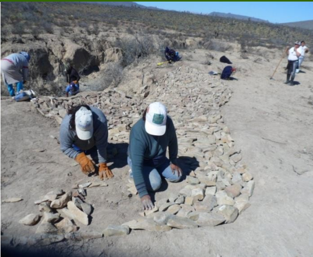
Cabeceo de cárcavas