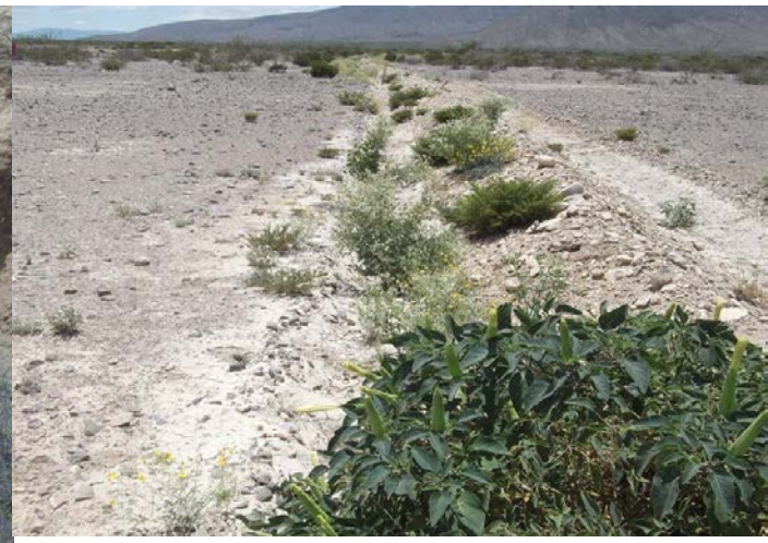
Rebote natural orégano

Encharcamiento y retención de azoles, prueba del funcionamiento de ambas obras: cabeceo y presas de Presas Filtrantes de Piedra Acomodada