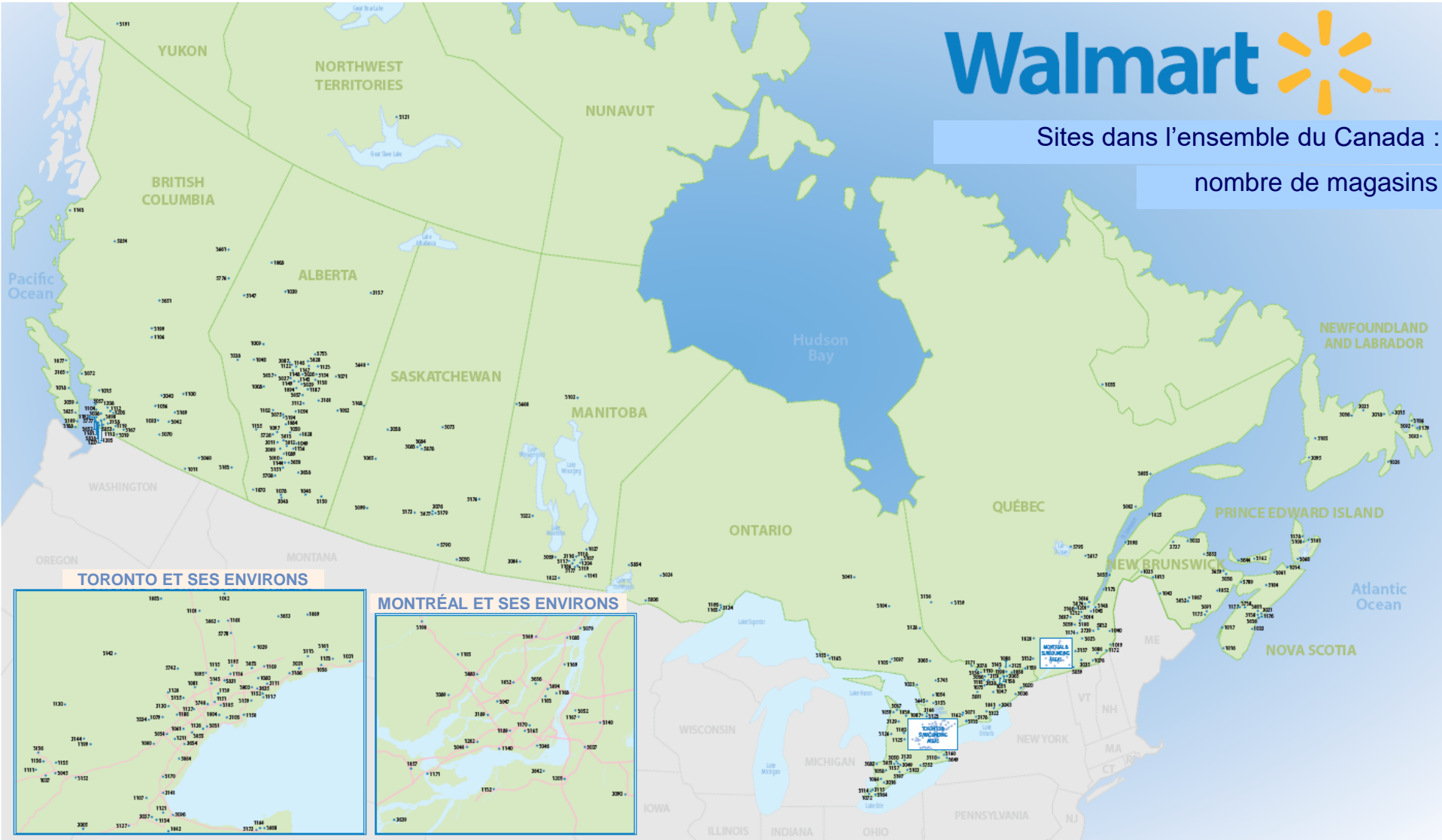
TORONTO ET SES ENVIRONS

Sites dans l'ensemble du Canada : nombre de magasins