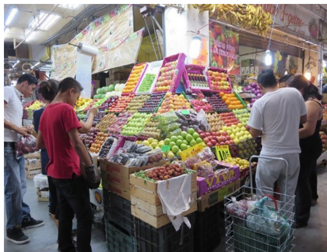
Figura 3. Clientes haciendo compras en el mercado.

Los vendedores que respondieron a la encuesta señalaron como principal motivo de preocupación los costos económicos y la pérdida de ganancia asociados a la PDA. Alrededor de 25 % de los encuestados indicaron también que, desde el punto de vista moral, les parecía inadecuado que los alimentos se desperdiciaran, mientras que un grupo más pequeño (alrededor de 10 %) expresó su preocupación por los daños causados al medio ambiente derivados de la producción, distribución y eliminación de alimentos que se desperdician.