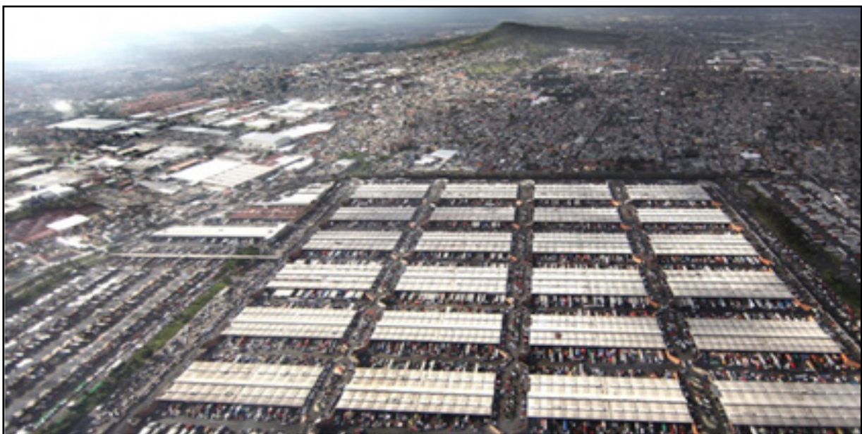
Figura 1. Vista aérea de la Central de Abasto, que cuenta con una superficie de 3.27 km 2 .

Los 158 participantes en la encuesta proporcionaron información valiosa relativa a la cantidad y causas de la pérdida y el desperdicio de alimentos en el mercado, lo cual permitirá a la CEDA perfilar esfuerzos futuros de prevención y reducción.