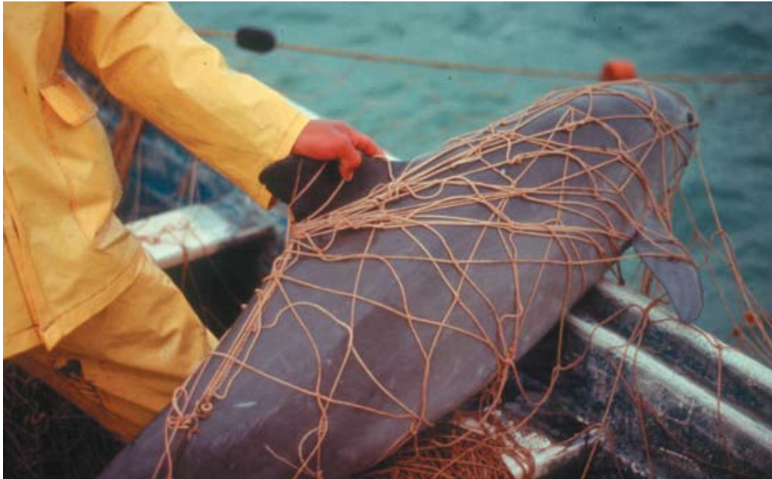
Vaquita muerta atrapada en una red La vaquita es susceptible de quedar atrapada en redes de muy diversos tamaños de luz de malla.

Los cuatro factores de riesgo mencionados con mayor frecuencia se resumen en los párrafos a continuación.