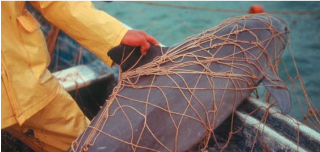
A vaquita drowned by entanglement The vaquita is vulnerable to entanglement in nets with a large range of mesh sizes

The four most frequently mentioned risk factors are summarized in the subsections below.